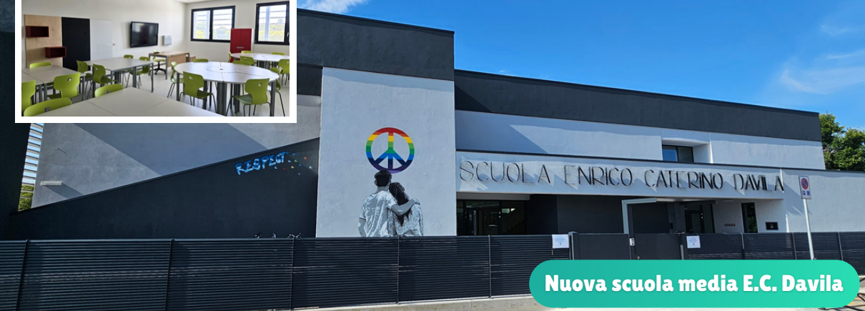
Nuova scuola media E.C. Davila