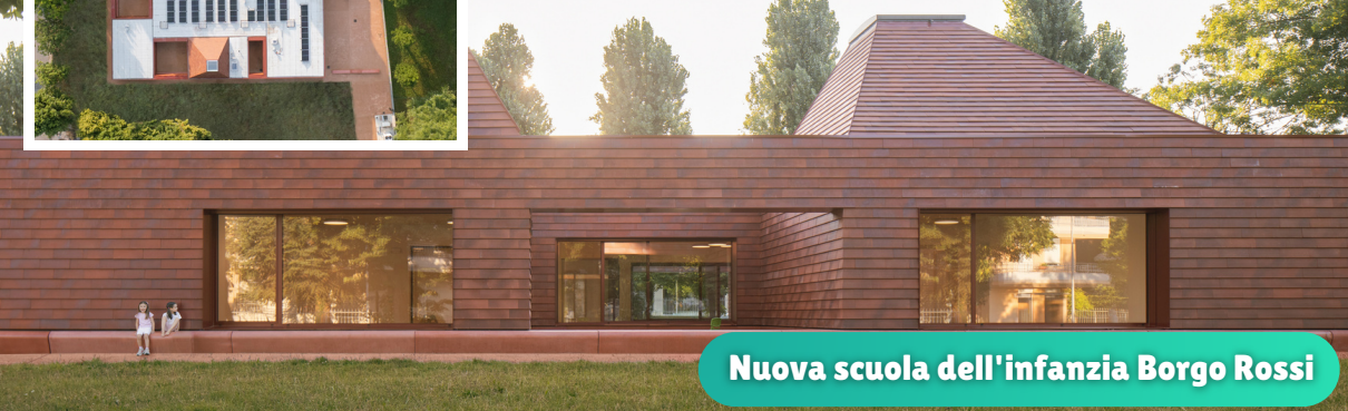
Nuova scuola dell'infanzia Borgo Rossi