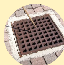
esempio di pulizia del dispositivo

PRESSO IL POLISPORTELLO - VIALE DEGLI ALPINI, 1 - SONO DISPONIBILI PER I CITTADINI, GRATUITAMENTE FINO AD ESAURIMENTO, CONFEZIONI DI PASTIGLIE LARVICIDA DA GETTARE NEI TOMBINI DI RACCOLTA DELLE ACQUE PIOVANE