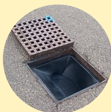
dispositivo installato all'interno del tombino stradale

Per il corretto funzionamento di dispositivi è necessario che lo sportello basculante rimanga chiuso, senza lasciare la minima fessura, e pertanto è opportuno che lo stesso rimanga pulito, senza residui di foglie o altri elementi estranei.