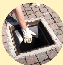
apertura dello sportello basculante